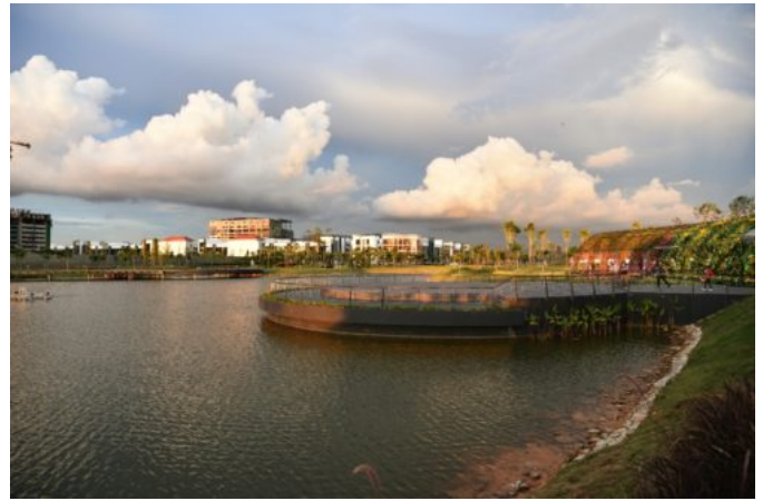
Batu Kawan menjadi tumpuan para pelabur kini.

“Kerajaan Negeri pula perlu memberi hak milik tanah di kawasan taman industri kepada PDC secara pegangan bebas (freehold) dan kita akan pajakkan kepada para pelabur dengan tempoh maksimum selama 30 tahun.