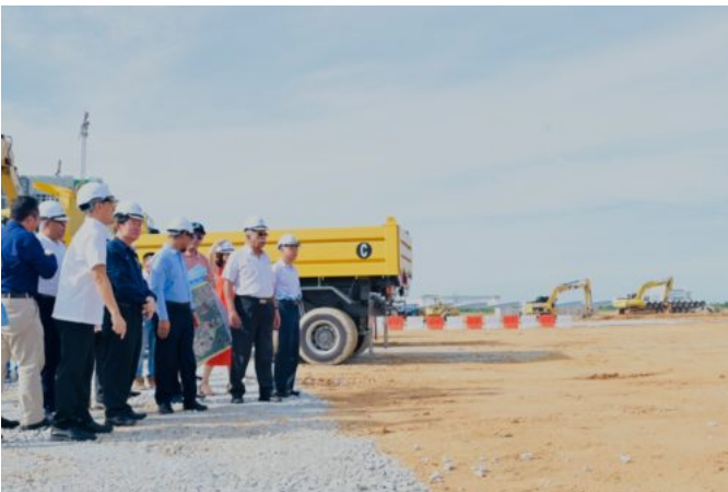
**拟开拓新工业园区**

值得一提的是，国际知名品牌欧司朗光电半导体（马来西亚）有限公司，即成为进驻桂花城科技园的首个企业，证明该园区颇受业界欢迎。