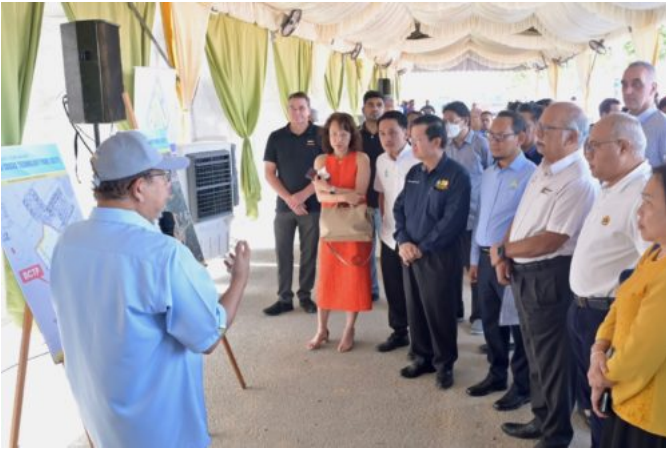
**首长：招商引资从不松懈**

他指出，这也代表槟州在招商引资，为槟州经济做出贡献方面从不松懈，尤其是在4年期间，还遇上了新冠疫情打击，槟州拥有这项成绩已经足以自傲。