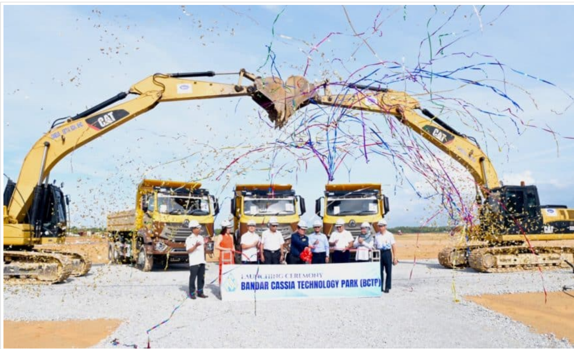
( https://www.buletinmutiara.com/wp-content/uploads/2023/05/IMG-20230520-WA0028.jpg )

May 20, 2023 ( https://www.buletinmutiara.com/%e9%83%bd%e5%8a%a0%e6%b9%be%e6%a1%82%e8%8a%b1/ )